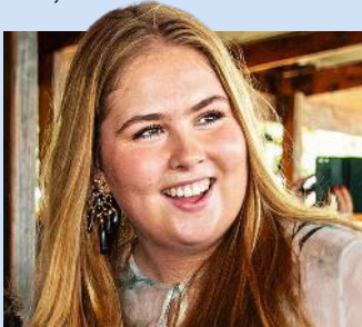
AMALIA DER NIEDERLANDE

■ Kleines Land, steinreiche Royals! Prinz Joseph Wenzel von und zu Liechtenstein (29) erbt mal das größte Vermögen in Europa. Sein Opa besitzt u.a. eine Privatbank in Vaduz, ist 8,6 Milliarden Euro schwer.