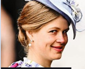
LADY LOUISE WINDSOR