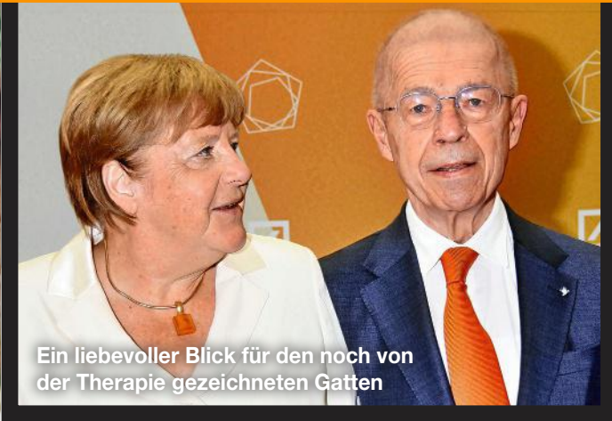
Ein liebevoller Blick für den noch von der Therapie gezeichneten Gatten