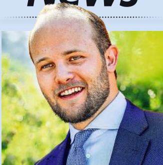
WENZEL ZU LIECHTENSTEIN