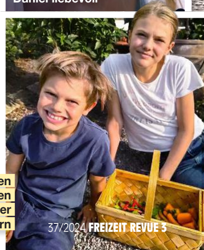
Im Gemüsegarten von Schloss Solliden ernteten die Geschwister Gesundes zum Knabbern