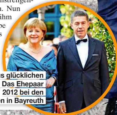
Ein Bild aus glücklichen Tagen: Das Ehepaar 2012 bei den Festspielen in Bayreuth

Gestärkt geht es nun zurück in den Berliner Alltag. Sie wird Kraft brauchen, um den geliebten Mann wieder aufzupäppeln. Jahrelang war er Halt und Stütze in ihrem anstrengenden Leben. Nun wird sie ihm alle Liebe geben, bis er wieder ganz gesund ist. ■