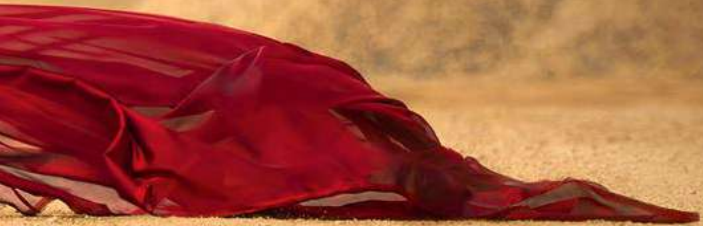
DOG PHOTOGRAPHY AWARDS