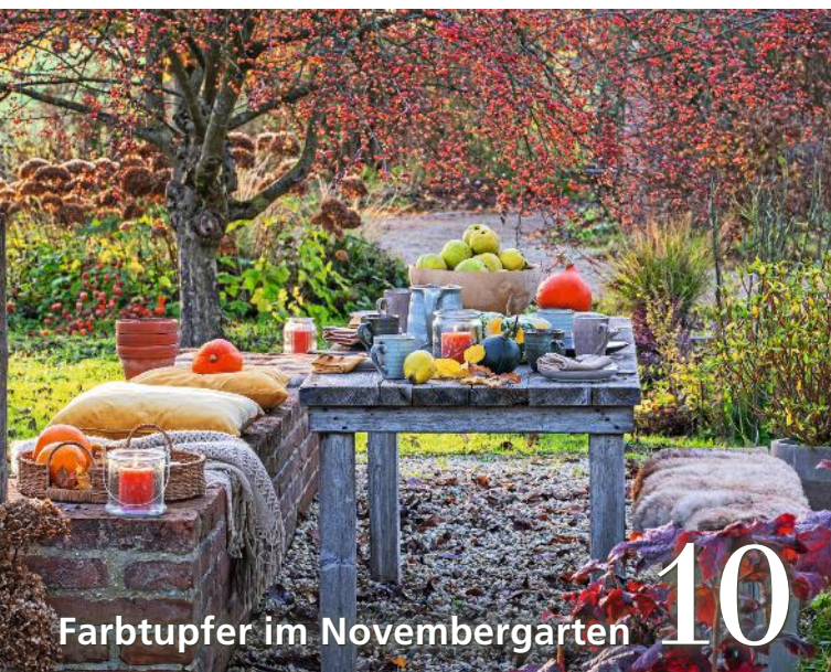
Farbtupfer im Novembergarten