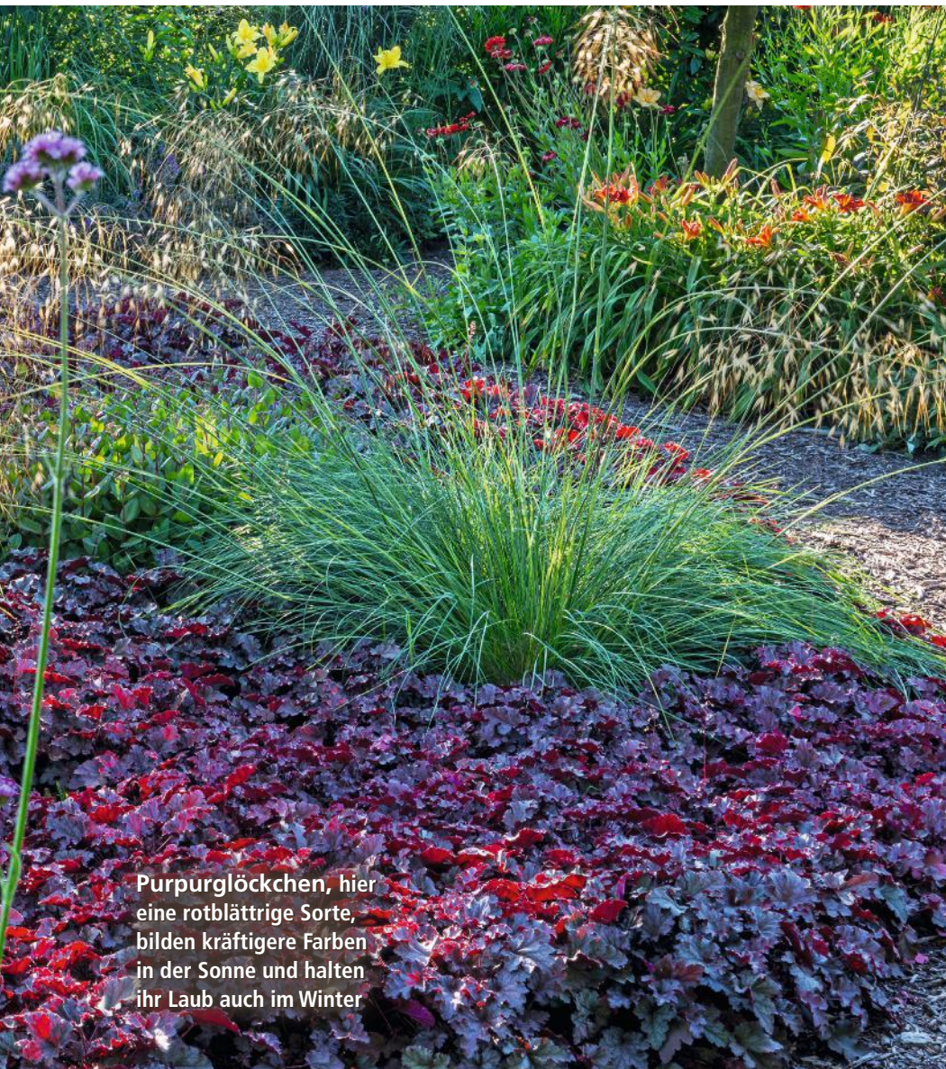
Purpurglöckchen, hier eine rotblättrige Sorte, bilden kräftigere Farben in der Sonne und halten ihr Laub auch im Winter