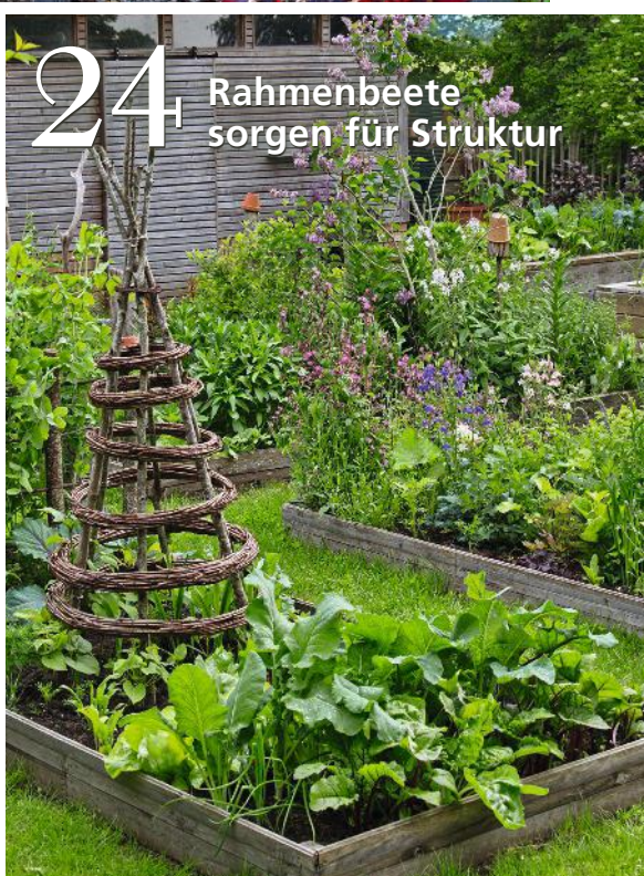
24 Rahmenbeete sorgen für Struktur