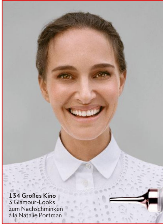
134 Großes Kino 3 Glamour-Looks zum Nachschminken à la Natalie Portman