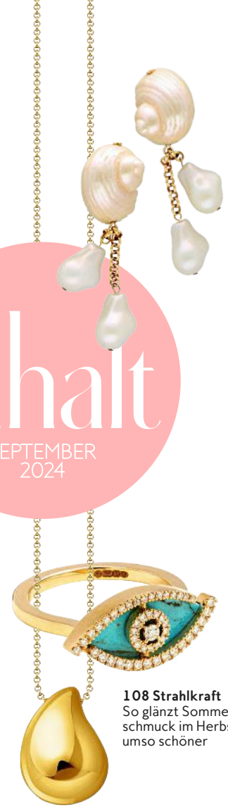
108 Strahlkraft So glänzt Sommerschmuck im Herbst umso schöner