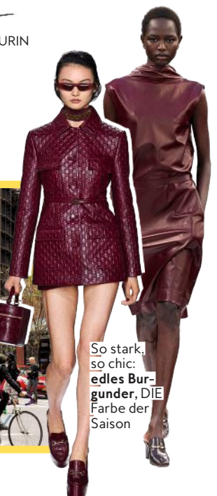
So stark, so chic: edles Bur- gunder , DIE Farbe der Saison