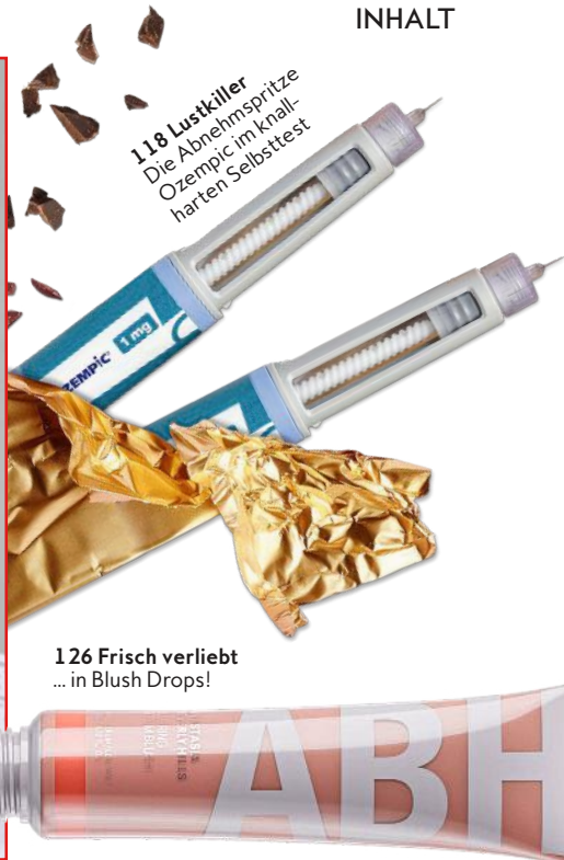
118 Lustkiller Die Abnehmspritze Ozempic im knall- harten Selbsttest