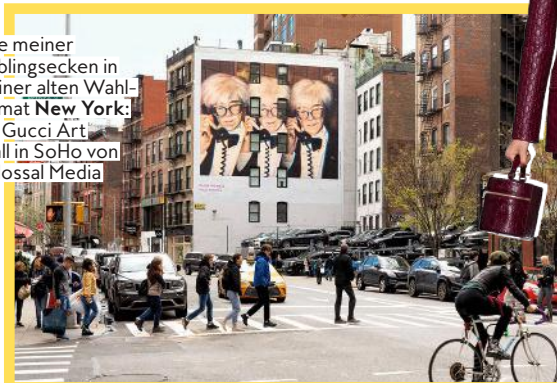
Eine meiner Lieblingsecken in meiner alten Wahl- heimat New York : die Gucci Art Wall in SoHo von Colossal Media