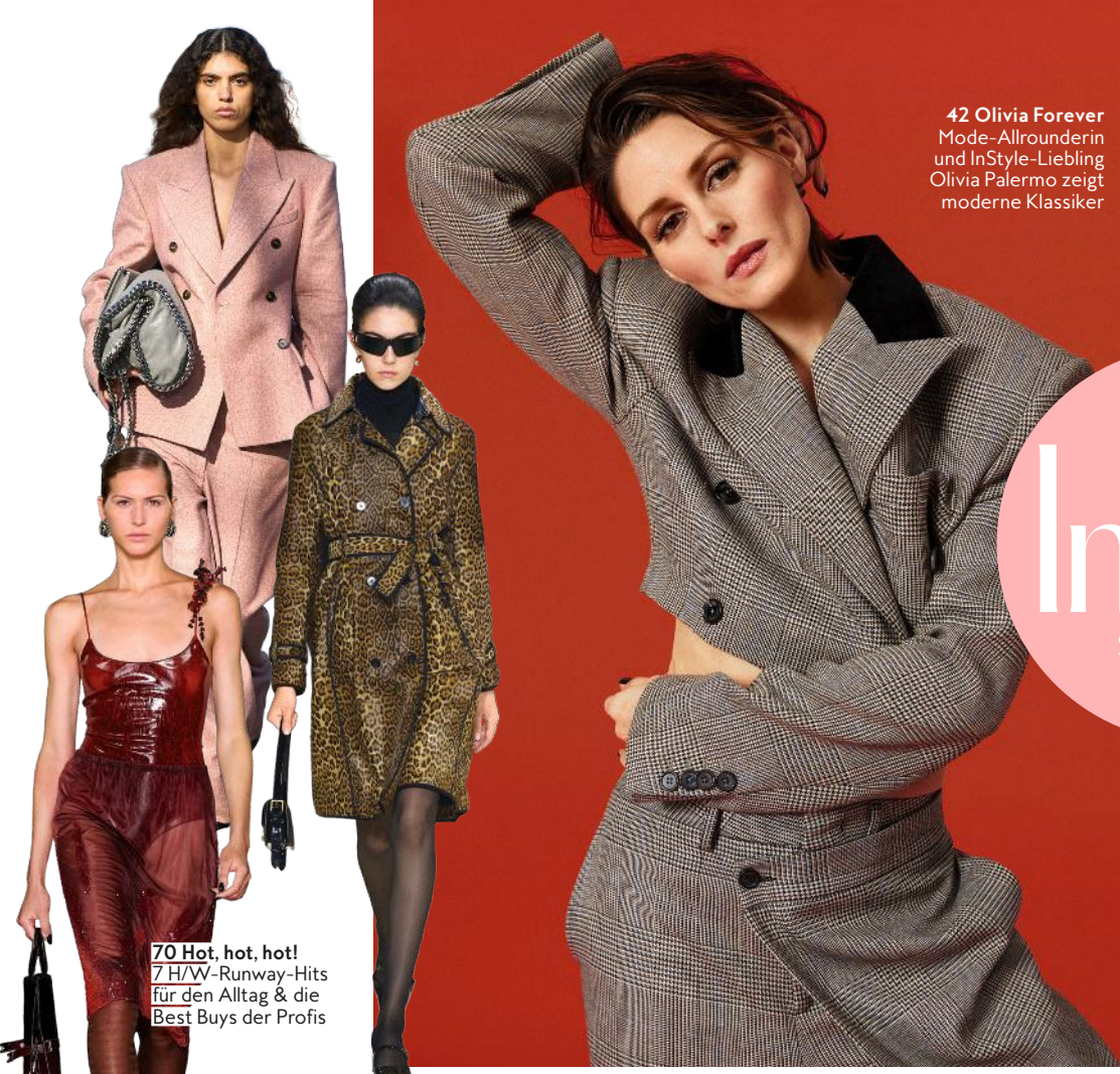
42 Olivia Forever Mode-Allrounderin und InStyle-Liebling Olivia Palermo zeigt moderne Klassiker