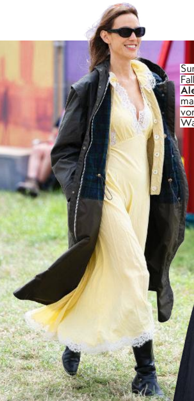
Summer goes Fall. Stilprofi Alexa Chung macht's perfekt vor: Slipdress zum Wachsmantel

Alexa Chung The Sophie Grützner CHEFREDAKTEURIN