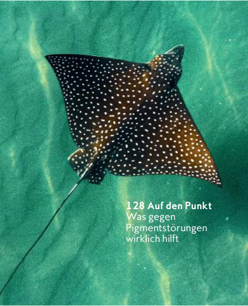
128 Auf den Punkt Was gegen Pigmentstörungen wirklich hilft