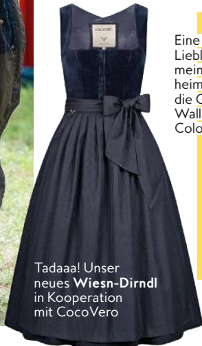
Tadaaa! Unser neues Wiesn-Dirndl in Kooperation mit CocoVero